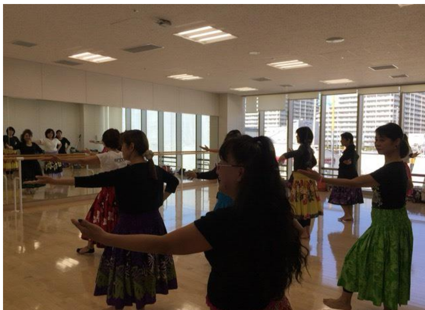
本年度よりスタート：フラダンス教室風景 於）美園コミュニティセンター